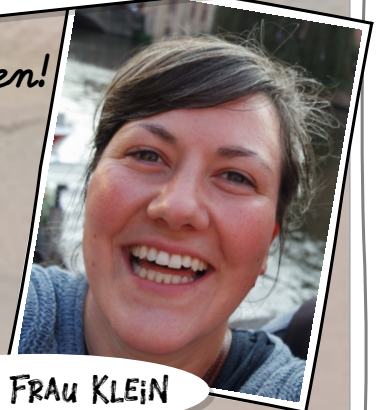
DEINE FRAU KLEIN

Ich bin gespannt auf dich, liebes Eisbärenkind!